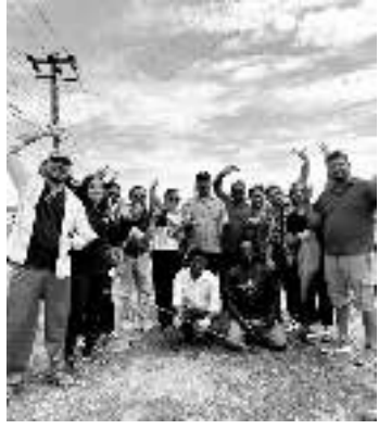
ग्रामीण संवादाता विराटनगर

नेपाल खेलकुद महासंघ विराटनगर महानगरपालिका कमिटीले सप्ताहव्यापी वृक्षारोपन कार्यक्रम सुरु गरेको छ। आज महासंघले विराटनगर महानगरपालिका वडा नं १ बाट सप्ताहव्यापी वृक्षारोपन कार्यक्रम सुरु गरेको हो। महासंघ विराटनगर कमिटीका अध्यक्ष