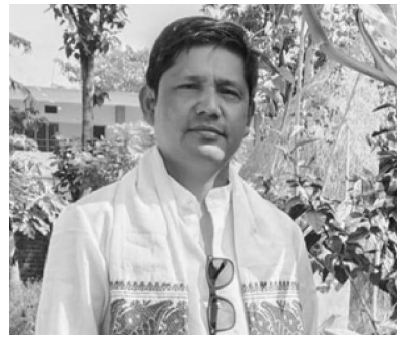
लेखक : आत्माराम राजवंशी

गौरिगन्ज । राष्ट्रिय भाषार मान्यता पाल खस भाषा एक्टा जाती विशेषेर ना हय । अइनड राजवंशी भाषाडअ राजवंशी जातीलार मात्रे बोल्वार भाषा नाहय । एक्टा बड समुदाय इड भाषाडक मातृभाषार रूपत प्रयोग करेचे । तराइ भेगत बसोबास कर्बार् राजवंशी, ताजपुरिया, गन्गाई, पुरुबतिंकार ठाकुर हजाम, केवरत, कोच कहाल, हलुवाई, सरवरिया, मुस्लिम, पुरुबतिंकार चौधरी, गोस्वामी, कोच, कोच काहाल, गिरीलगायत आहं भेलेला जाती एकेरा मातृभाषा प्रयोग करेचे । इला जातिर उर्नापिर्ना, खानपान, पावनीपोल, ग्रामथान, सांस्कृतिक नाचगान, वेहावालन, बोलीभाषा एके किंसमेर छे । एके पहिचान, एके बोली भाषा, एके रहन सहन, एके पावनीपोल, एके किंसमेर ग्रामथान हलउं भाषा नामाकरणत एकरूपता निछे । प्रादेशिक हिसाबसे करीब १५,००००० (पन्ध्र लाख) भाषीला एकेरा मातृभाषा बलेचे । भापा, मोरड आर सुनसरी जिल्लात बसोबास कर्बार् राजवंशी जातीर मात्रे जनसंख्या २ लाख से बेसी आर भाषा वत्ताले उहार से आहं बेसी हवार अनुमान करा जाचे । र राष्ट्रिय तथ्यांक विभागसे सार्वजनिक कराल राष्ट्रिय जनगणना २०७८ रत भापा, मोरड आर सुनसरी जिल्लात विशेष बसोबास कर्बार् र राजवंशी जातीर जनसंख्या १,३२,५६४ जानाईचे । जेडड जनसंख्या आंकडा गलत छे कहने चाहती आलोचना हले । भापा जिल्लात मात्रे देखे खस समुदायर बाद दसा स्थानत र राजवंशी भाषीला छे । शब्द आर उच्चारण देखे एके किसिमेर